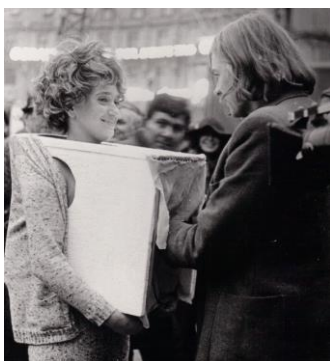
ALIE EXPORT, Tapp- und Tastkino, 1968

Auch Renate Bertlmann (*1943) und Gudrun Kampl (*1964) verhandeln Körperlichkeit und Begehren über Materialität. Bertlmanns „Glaserherz“ thematisiert Verletzlichkeit und Aggression, während Kampls Samtobjekte gezielt den Wunsch nach Berührung evozieren, ihn aber zugleich unterlaufen. Berührung erscheint hier als ambivalente Erfahrung zwischen Anziehung, Abwehr und kultureller Zuschreibung.