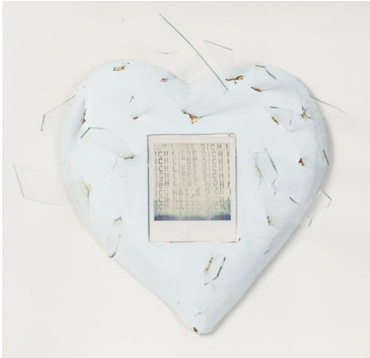
Renate Bertlmann, Glaserherz, 1986, Landessammlungen NÖ © Bildrecht, Wien 2026