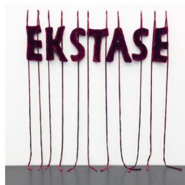
Gudrun Kampl, Ekstase, 2021, Galerie Steinek