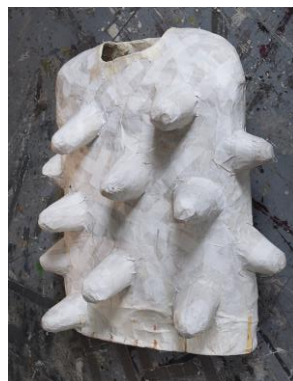
Tone Fink, BUSENGEWAND, 1990