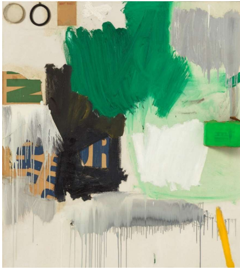
Robert Rauschenberg, Vitamin , 1960/1968, Öl, bedrucktes Papier, Karton, Gummi, Plastik, Nägel und Haken auf Leinwand