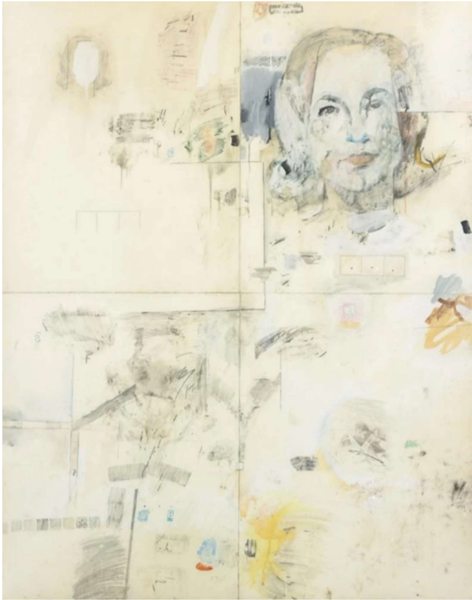
Robert Rauschenberg, Portrait of Ethel Scull , 1962, Lösungsmitteltransfer, Malkreide, Öl, Wasserfarbe und Grafit auf Papier, montiert auf Pappe, Collection Thaddaeus Ropac, London · Paris · Salzburg · Milan · Seoul © The Robert Rauschenberg Foundation / Bildrecht, Wien 2026