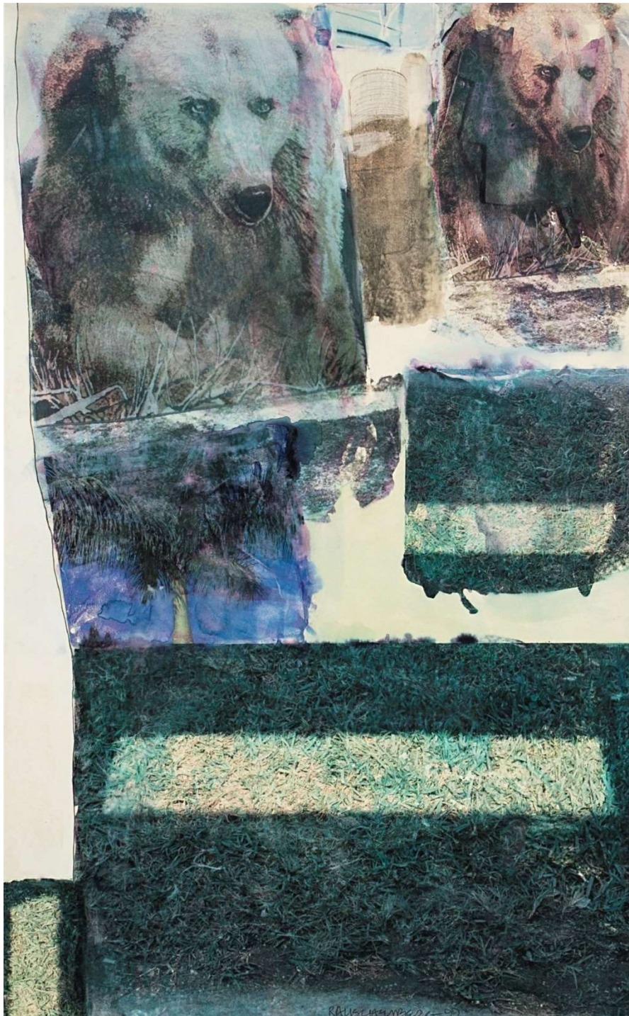
Robert Rauschenberg, Bear Grass [Anagram (A Pun)] , 1999, Inkjetdruck-Transfer und Grafit auf Polylamin, Courtesy Galerie Thaddaeus Ropac, London · Paris · Salzburg · Milan · Seoul © The Robert Rauschenberg Foundation / Bildrecht, Wien 2026