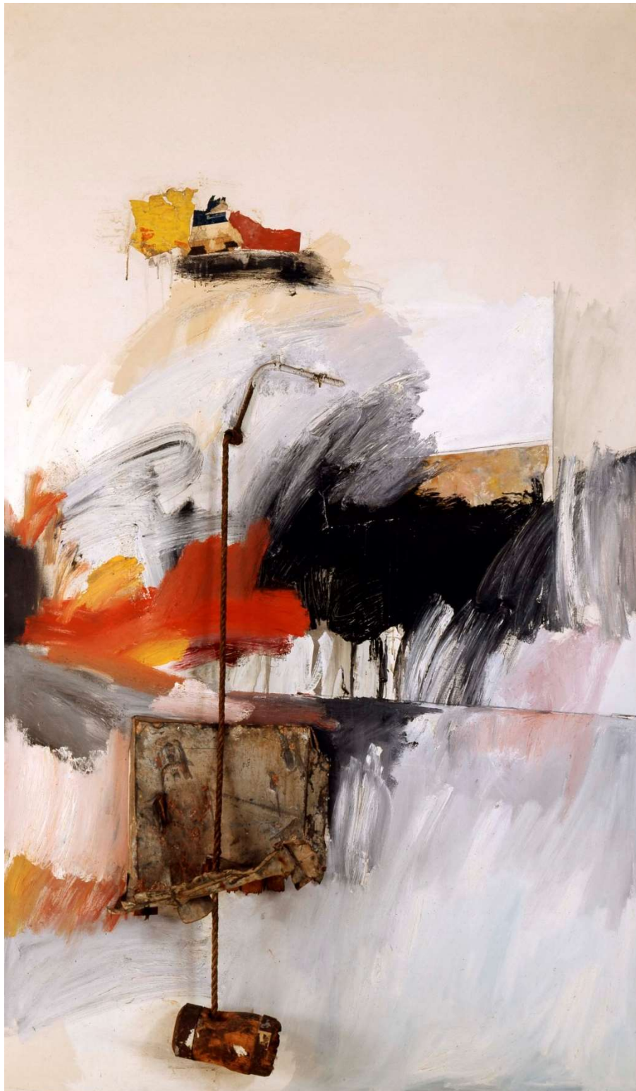
Robert Rauschenberg, Rigger , 1961, Öl, Metall, Seil, Holz, Textilien, Plastikknöpfe, Papier, Grafit und Sand auf Leinwand, Private Collection, Europe. Courtesy Galerie Thaddaeus Ropac, London · Paris · Salzburg · Milan · Seoul © The Robert Rauschenberg Foundation / Bildrecht, Wien 2026, Foto: Eva Herzog