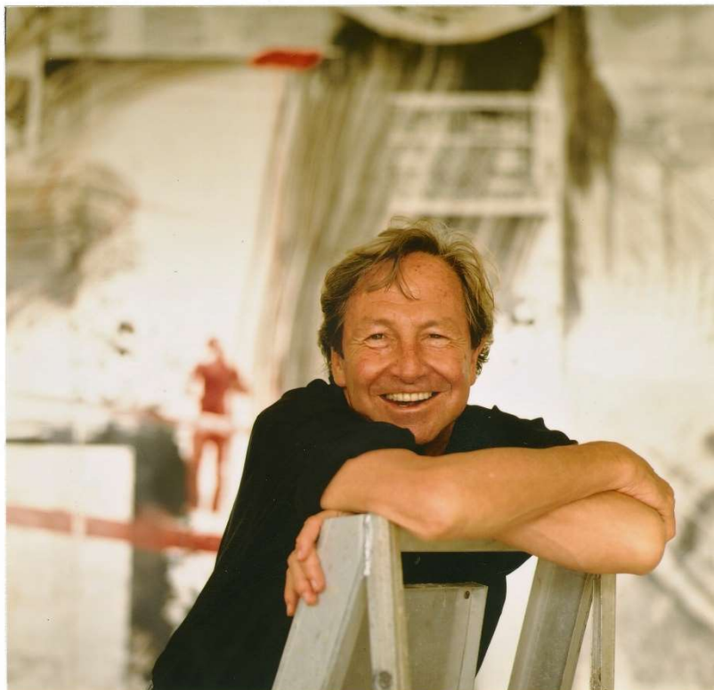
Robert Rauschenberg mit einem Ausschnitt von The 1/4 Mile or 2 Furlong Piece (1981–98), Captiva, FL, United States, May 1992.

2002 erlitt Rauschenberg einen Schlaganfall. Ungeachtet von Einschränkungen arbeitete er weiter, zuletzt oft mit Unterstützung von Assistent:innen. Robert Rauschenberg starb am 12. Mai 2008 in Captiva. Sein Werk steht für die innovative Verbindung von Malerei, Fotografie und Alltagsmaterialien und prägte die Entwicklung der Kunst weit über seine Generation hinaus.