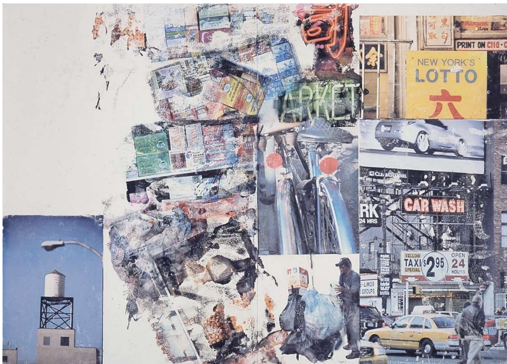
Robert Rauschenberg, Random Want (Scenario), 2003, Inkjetdruck-Transfer auf Polylaminat, Privatsammlung