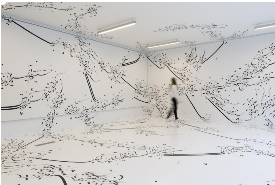
Parastou Forouhar, Written Room, Institut des Cultures D'Islam, 2017, Paris

2026 wird die eindrucksvolle Rauminstallation erstmals in Österreich gezeigt. In aufwändiger Handarbeit überzieht Forouhar den vollständig weiß gestrichenen Ausstellungsraum mit Textsplintern und Wortfragmenten in persischer Schrift. Mit schwarzer Farbe gemalt, fließen sie über Boden und Wände, folgen dem geschwungenen Duktus der Kalligrafie und lassen ein ornamentales Bild entstehen, das den Raum vollständig durchzieht.