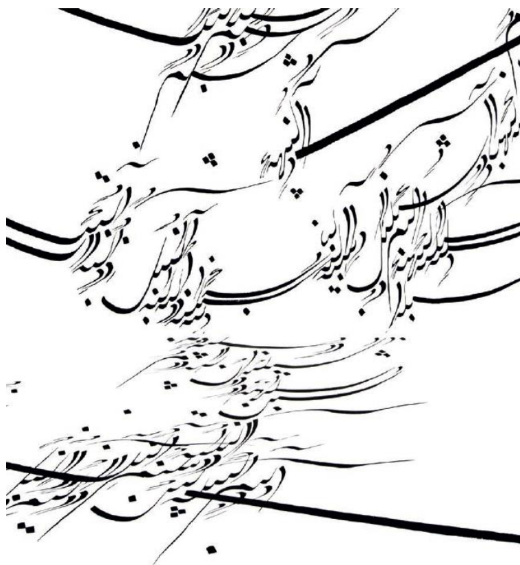
Parastou Forouhar, Written Room (Detail), Craft Contemporary Museum, LA, 2024