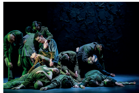
Österreich-Premiere für einen Double-Bill-Abend des Hessischen Staatsballetts