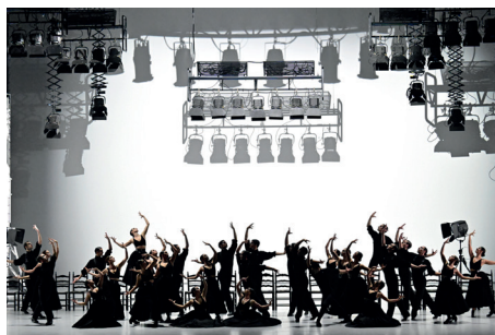
Großformatig: Marcos Moraus Reminiszenz an den Fotografen Ruven Afanador