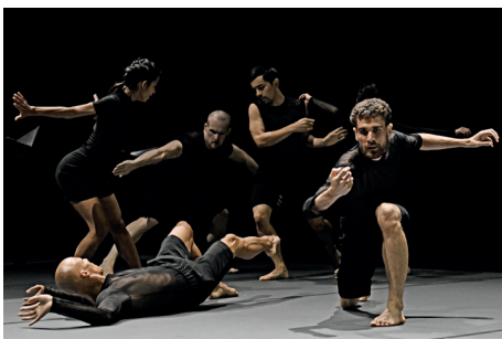
Das Hessische Staatsballett zeigt u. a. I'm afraid to forget your smile .