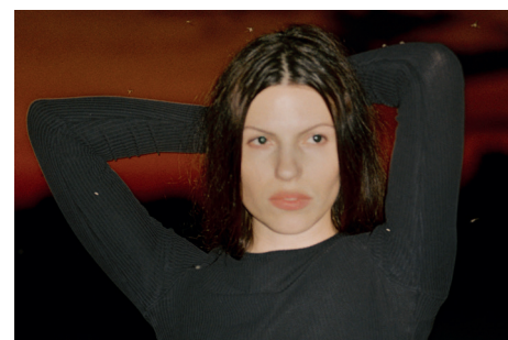
Soap&Skin macht im Rahmen ihrer Torso -Tour einen Stop im Festspielhaus.