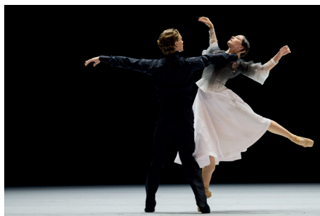
Das Ballett Zürich taucht ein in die Welt der Clara Schumann.