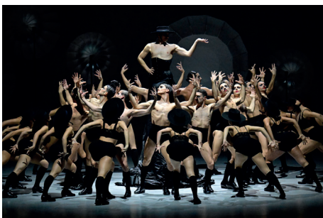
Saisoneneröffnung im Zeichen des Flamenco mit dem Ballet Nacional de España

Ein weiteres Gastspiel rückt das Schaffen von Marcos Morau im Rahmen eines Double Bill-Abends mit dem Nederlands Dans Theater NDT 2 am Samstag, 09. Mai 2026 ins Zentrum. Mit Folkå präsentiert Morau eine pulsierende visuelle und auditive Landschaft, die über Gemeinschaft, Bräuche und Traditionen erzählt. Im zweiten Teil des Abends kommt Wir sagen uns Dunkles von Marco Goecke zur Aufführung.