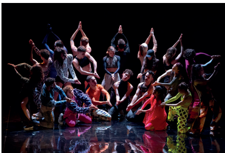
Das CCN – Ballet de Lorraine ist mit a Folia von Marco da Silva Ferreira ...

Die ekstatische Freude am gemeinsamen Tanz auf Raves und in Nachtclubs bildet den Ausgangspunkt für den Double Bill-Abend mit dem CCN – Ballet de Lorraine . Malón von Ayelen Parolin verweist auf einen Zustand der Unordnung, wenn Bewegung bei einem Rave bis zum Exzess gesteigert wird. a Folia von Marco da Silva Ferreira ist eine Anspielung auf einen festlichen portugiesischen Hirtentanz aus dem 16. Jahrhundert. Indem er die mitreißende Wirkung dieses Volkstanzes aufgreift, überträgt der Choreograf ihn auf das Tanzen in Nachtclubs.