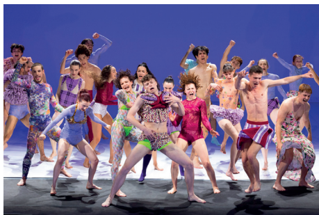
1 Tag alle Räume: Das CCN – Ballet de Lorraine präsentiert sich mit zwei Choreografien.

Das internationale BIG BANG Festival verwandelt das Festspielhaus am Samstag, 18. April 2026 erneut in ein abenteuerliches Musiklabyrinth zum Erkunden und Genießen, für alle von 5 bis 105 Jahren. In Kooperation mit der Jeunesse, der Stadt St. Pölten sowie der belgischen Zonzo Compagnie .