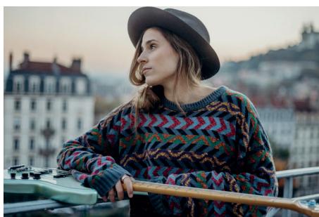
Die polnische Jazz-Bassistin des Jahres 2015 Kinga Głȳk begeistert im Festspielhaus.