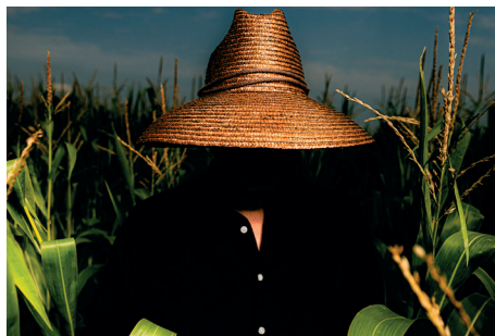
Dekker: Indie-Folk mit übergroßem Hut im On-Stage-Setting auf der Bühne