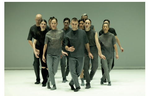
Das Dance On Ensemble kehrt für 1 Tag alle Räume ins Festspielhaus zurück.