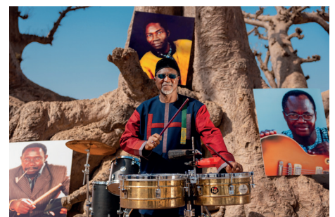
Das Orchestra Baobab aus dem Senegal feiert sein 50-jähriges Bestehen.