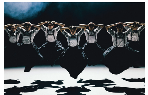
Das Nederlands Dans Theater NDT 2 ist endlich wieder in Österreich zu erleben.