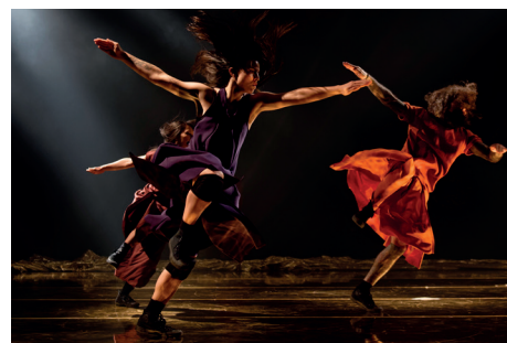
Saisonfinale mit Tanz, Akrobatik und Ballett der Compagnie Hervé Koubi