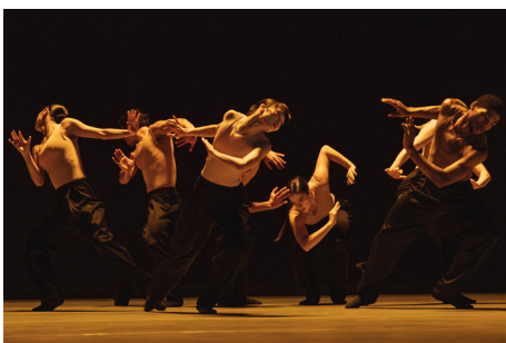
Das Ballet BC aus Vancouver eröffnet die Saison mit u. a. einer Arbeit von Crystal Pite.

Anne Teresa De Keersmaecker verbindet Tanz, Musik und Konzept zu rigorosen, raumzeitlichen Strukturen – von Steve Reich bis Johann Sebastian Bach, von Oper bis Museum. Nachdem die flämische Avantgarde-Ikone zuletzt im Dezember 2022 mit ihrer Kreation Mozart/Concert Arias im Festspielhaus zu Gast war, kehrt sie nun – erneut mit dem Opera Ballet Vlaanderen – zurück nach St. Pölten und präsentiert am Samstag, 07. November 2026 einen Triple-Bill-Abend als Reise durch ihr choreografisches Schaffen als Österreich-Premiere: 1986 setzte sich De Keersmaecker erstmals mit Béla Bartóks Streichquartett Nr. 4 auseinander und erschuf eine Choreografie, die die komplexen Rhythmen und Harmonien des Werkes sowohl kämpferisch als auch verspielt erobert. 1992 widmete sie sich Beethovens Großer Fuge und übersetzte deren Kontrapunkte mit kraftvollem Bewegungsvokabular in physische Form. Mit Arnold Schönbergs Verklärte Nacht tauchte sie 1995 in eine Romanze ein, die in Duetten und Trios die Geschlechterrollen hinterfragt und neu interpretiert. Jedes dieser Werke versteht sich als choreografische Antwort auf klassische Musik und zeigt De Keersmaeckers einzigartiges Gespür für Erzählung.