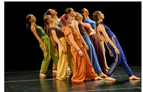
STEP by STP, die Jugendtanzcompagnie von Festspielhaus, Stadt St. Pölten und MKM