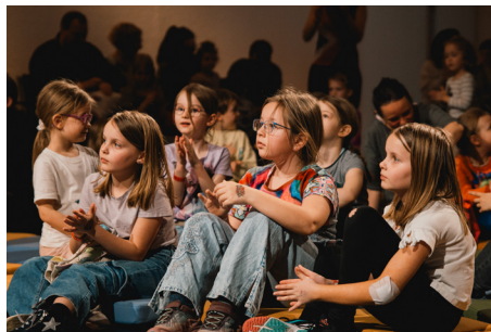
Ein ganzer Tag voller musikalischer Abenteuer mit dem BIG BANG Festival