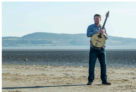
Irish Folk Symphonic: Daoirí Farrell in einem Crossover mit dem Tonkünstler-Orchester