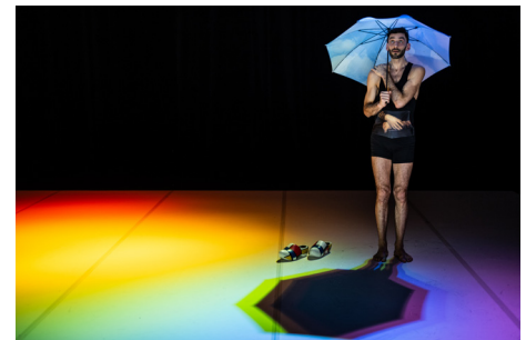
Was bleibt von einer Reise? Jede Menge Mitbringsel! Souvenirshop für Kinder ab 4