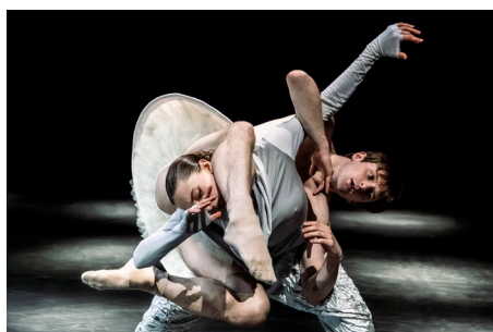
Sucht weltweit seinesgleichen: Das renommierte Nederlands Dans Theater – NDT 1