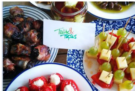
Über das Gesehene sprechen, und das bei kleinen Köstlichkeiten: Talk & Tapas