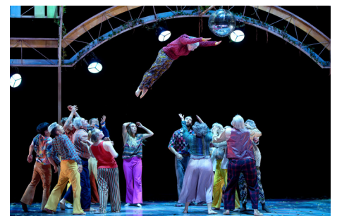
Im Großen Saal mit Profis, auf dem Vorplatz mit tanzbegeisterten Laien: Beauséjour