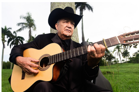
Nostalgischer Latin-Flair aus Kuba mit Eliades Ochoa

Souad Massi wuchs in Algier auf und kam dort mit einer Vielzahl musikalischer Stile in Berührung: Blues, Folk, Rock, arabisch-andalusische Musik und Raï, die algerische Popmusik. Zudem war sie Leadsängerin der in Algerien berühmten Heavy-Metal-Band Atakor. In ihren Liedern, die sie auf Arabisch, Französisch und in der Berbersprache Kabylisch singt, lehnt sich Massi gegen politische Unterdrückung und gesellschaftliche Ungerechtigkeit auf. Ihre poetischen Texte, ihr melancholischer Alt, Folk und Rock verbinden sich auf ihrem neuen Album Zagate zu einer einzigartigen Musik, die kraftvoll und fragil zugleich ist. Am Freitag, 15. Jänner 2027 ist die Singer-Songwriterin im Festspielhaus St. Pölten zu Gast.