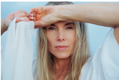
Rebekka Bakken aus Norwegen sorgt für skandinavische Magie auf dem Domplatz ...