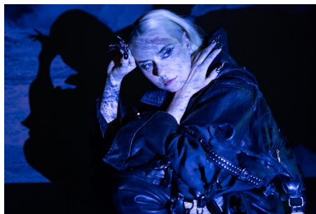
... ebenso wie Eivør von den Färöer-Inseln: Ein Open-Air im Zeichen der Nordlichter .