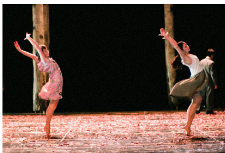
Anne Teresa De Keersmaecker zeigt drei frühe ikonische Choreografien.