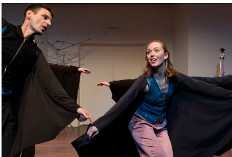
Die Fledermäuse sind los, wenn die schallundrauch agency ihr Stück für Kinder ab 5 zeigt

Aus einem einzigen Stück Seidenpapier entsteht eine poetische Erlebniswelt für ein allerjüngstes Publikum ab 1 Jahr. Es wird mal zu Schnee, mal zum Meer oder zu einem geheimnisvollen Wesen. In dieser behutsamen Verbindung von Musik, Körper und Objekt lädt die Compagnie Les Bestioles am Donnerstag, 11. Februar 2027 zu einer Reise ins Reich der eigenen Vorstellungskraft ein.