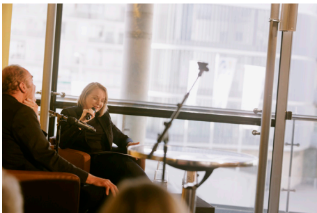
Das Talk-Format Salon D lädt zu einem Austausch mit renommierten Sprecher:innen.

STEP by STP ist ein Gemeinschaftsprojekt des Festspielhaus St. Pölten mit dem Musik & Kunst Schulen Management Niederösterreich und der Musikschule der Landeshauptstadt St. Pölten .