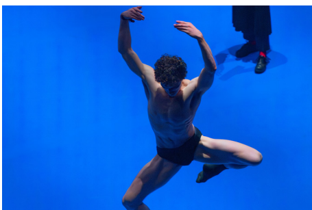
Chapters of Celebration : Auch das Festspielhaus feiert in mehreren „Kapiteln“ seinen 30er.

Jede Menge FEST/ MOMENTE wird es anlässlich eines groß angelegten Community-Projekts geben, das sich thematisch rund um die Circus-Premiere Beauséjour der französischen Compagnie Käfig (siehe S. 7) dreht. Bei einem Open Call für tanzbegeisterte Menschen jeden Alters werden zu Beginn des Jahres 2027 rund sechzig bewegungsfreudige Teilnehmer:innen gecastet. Unter der Leitung von Mourad Merzouki und seinem Team wird anschließend in einem intensiven, dreimonatigen Probenprozess auf das große Finale, einen Open-Air-Auftritt vor Publikum auf dem Festspielhaus Vorplatz, hingearbeitet.