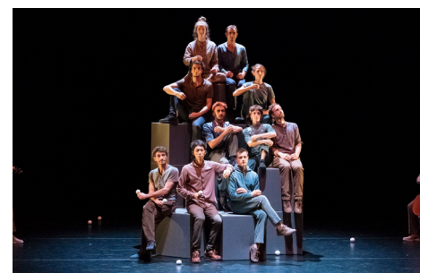
Erstmals: Circus-Festival als Initiative von Festspielhaus und Bühne im Hof