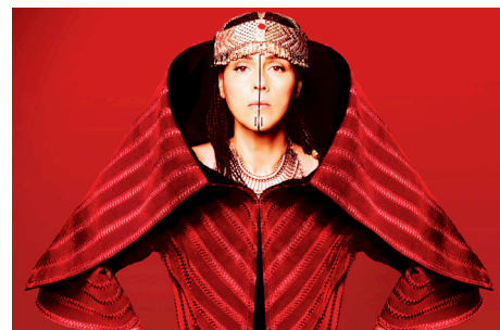
Souad Massi, Singer-Songwriterin aus Algerien, gastiert mit ihrem Album Zagate .