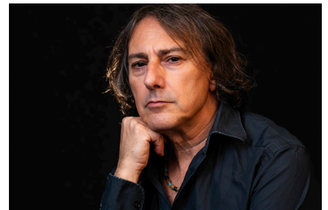
Aus Sizilien nach St. Pölten: Pippo Pollina, ein Cantautore im besten Sinne