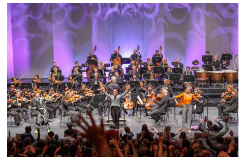
Neujahrskonzert-Spaß für die ganze Familie: Alles Walzer!