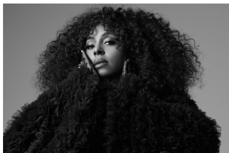
Ledisi ist mit neuem Album zu hören, einer Hommage an Dinah Washington