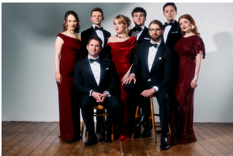
Das A-cappella Ensemble VOCES8 kehrt nach St. Pölten zurück.