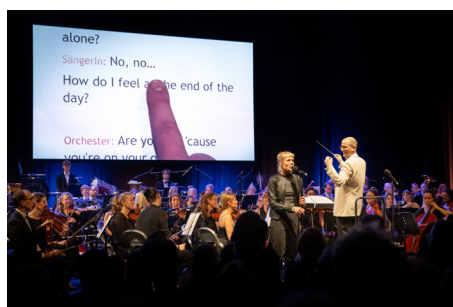
Mit Orchesterkaraoke feiert das Festspielhaus sein stimmungswaltiges Publikum mit symphonischer Wucht.