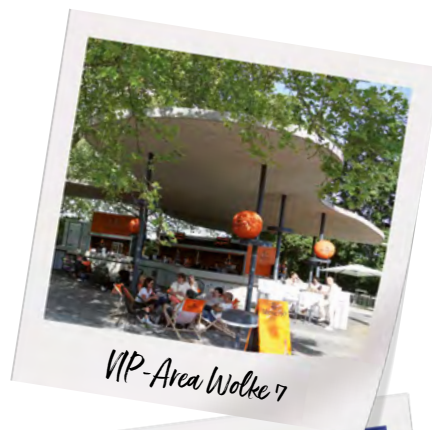
VIP-Area Wolke 7